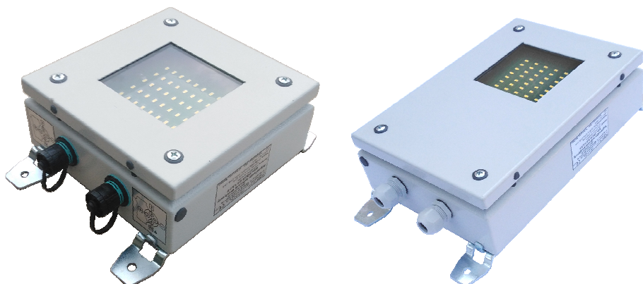
Sygnalizator optyczno – akustyczny (oświetlacz) ESOA-9.0.1.6.0.0