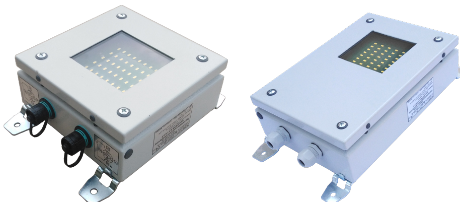
Sygnalizator optyczno – akustyczny (oświetlacz) ESOA-9.0.1.6.0.0